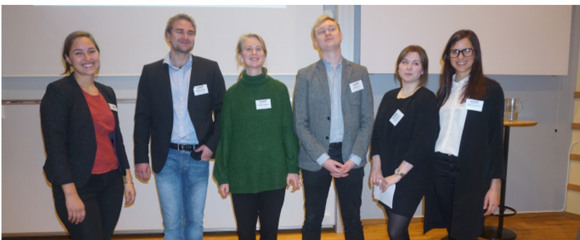
Foto: Del av Traineegänget 2015 vid slutrapportering i Söderhamn.