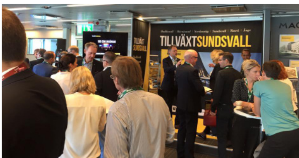
Foto: Övre - Rekryteringsmässan. Nedre - Business Arena